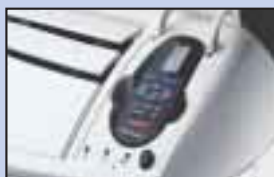
Télécommande infrarouge (version Aélia II 14 RC IR)